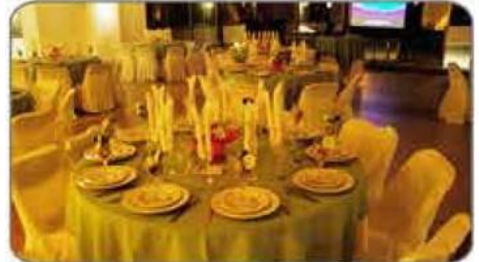
Salón Norte / Recoleta