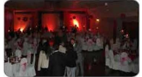
Salón Sub Oficiales Fach / Stgo Centro