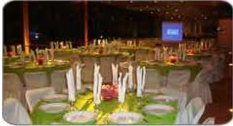
Salón Sub Oficiales / Maipú

Consultar por nuestra gama de salones en otras comunas, que pueden ser incorporados dentro de este presupuesto