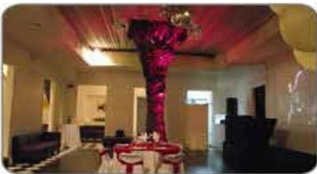
Salón Casa Luz / Stgo. Centro