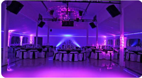
Salón Melipilla/ Maipú