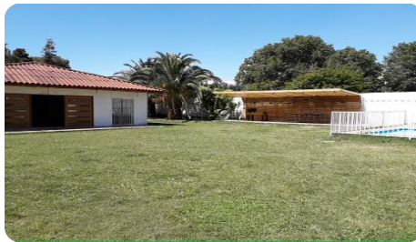
Salón La Pintana / La Pintana