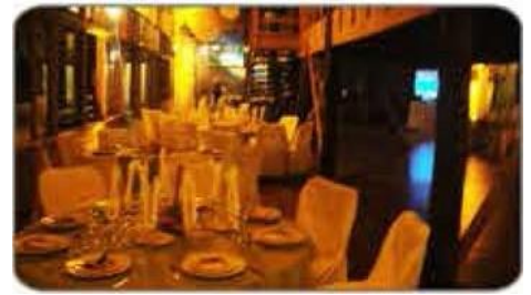
Salón Casino / San Bernardo