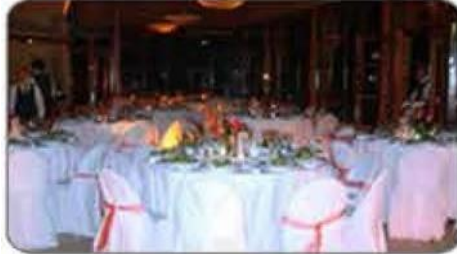
Salón Refugio / La Reina