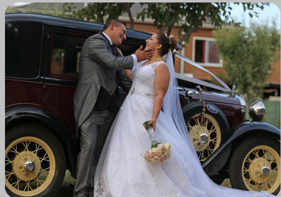
LIMUSINA LINCOLN BLANCA O BURRITA FORD